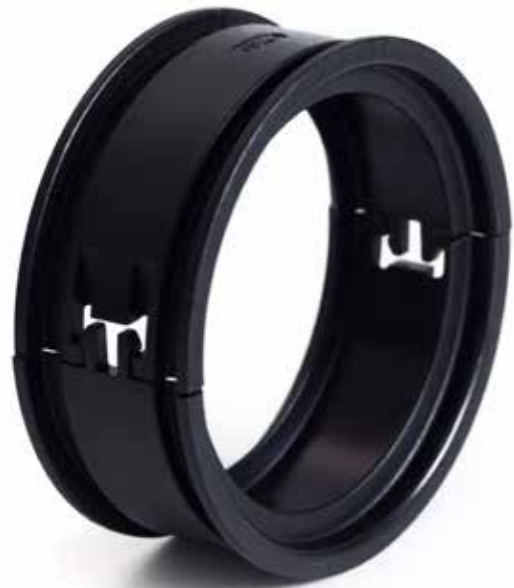
Kombischelle NW 70 60603008 schwarz Material: PA

Der Systemhalter NW 70 ist das Kernstück eines modularen Schlauchhalter-systems. Der Systemhalter ist kompatibel mit anderen gängigen Gelenkstücken und Halbschalen der NW 70 von verschiedenen Herstellern. Der Systemhalter ist in der Automatisierungs- und in der Roboterausrüstungstechnik anwendbar. Für den dynamischen Einsatz mit hoher Beweglichkeit des Schlauchpaketes am Befestigungspunkt genauso wie für eine starre Anwendung mit sicher geführten Leitungen und Schläuchen, mit oder ohne Zugentlastung. Das gesamte System bietet höchste Leistungen in Hinsicht auf Stabilität und Dauerhaltbarkeit.