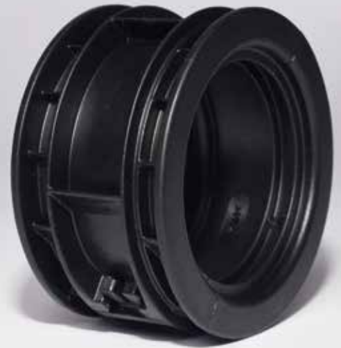
Kombischelle/Halbschale NW 48 60603011 schwarz Material: PA

Der Systemhalter ist das Kernstück eines modularen Schlauchhaltersystems. Der Systemhalter ist kompatibel mit anderen gängigen Gelenkstücken und Halbschalen der NW 48 und 52 von verschiedenen Herstellern.