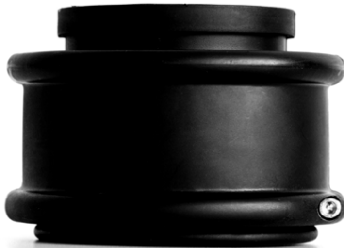
Kugelgelenk 60601700 schwarz Material: PA

Das Kugelgelenk ist kompatibel mit anderen gängigen Systemhaltern der NW 70 von verschiedenen Herstellern und alle gängigen Wellrohr Typen der NW 70.