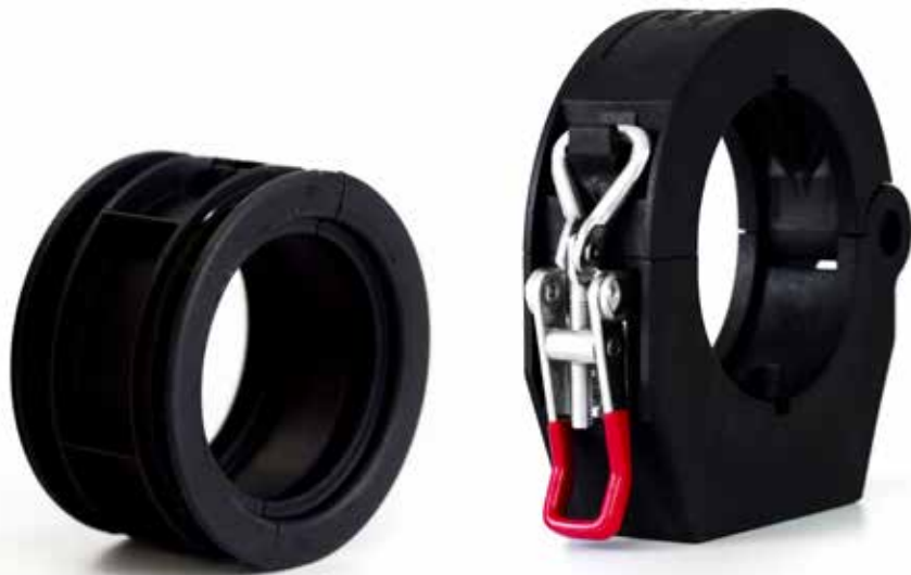
Kombischelle/Halbschale NW 48 60603012 schwarz Material: PA