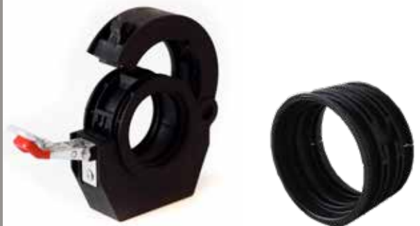
Kombischelle/Halbschale NW 52 60603012 schwarz Material: PA