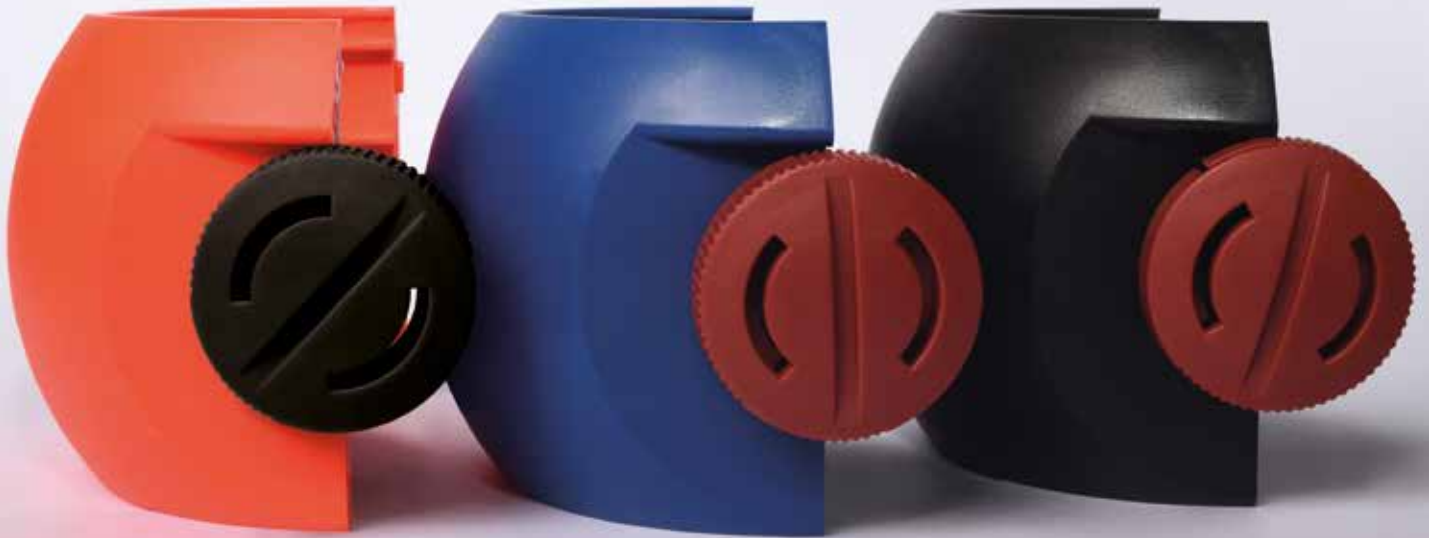
Protector 60601269 rot Material: PA