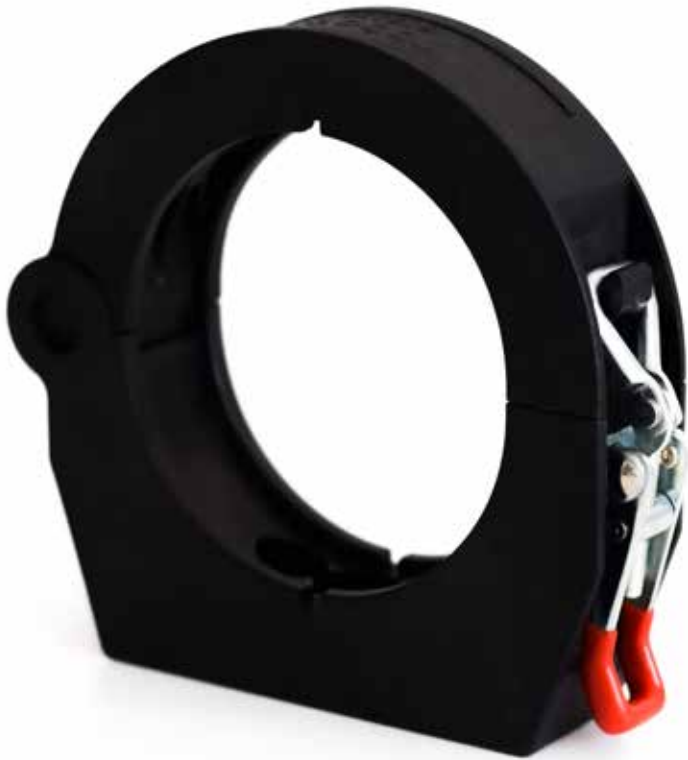
Systemhalter NW 70 60903013 schwarz Material: PA