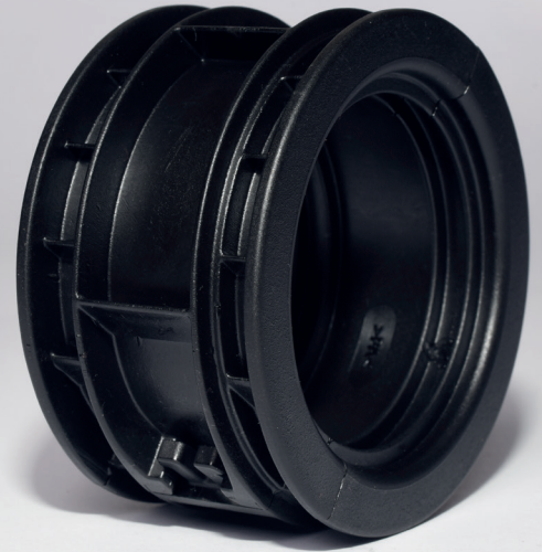
Kombischelle/Halbschale NW 48 60603011 schwarz Material: PA

Der Systemhalter ist das Kernstück eines modularen Schlauchhaltersystems. Der Systemhalter ist kompatibel mit anderen gängigen Gelenkstücken und Halbschalen der NW 48 und 52 von verschiedenen Herstellern.