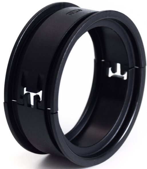
Kombischelle NW 70 60603008 schwarz Material: PA

Der Systemhalter NW 70 ist das Kernstück eines modularen Schlauchhalter-systems. Der Systemhalter ist kompatibel mit anderen gängigen Gelenkstücken und Halbschalen der NW 70 von verschiedenen Herstellern. Der Systemhalter ist in der Automatisierungs- und in der Roboterausrüstungstechnik anwendbar. Für den dynamischen Einsatz mit hoher Beweglichkeit des Schlauchpaketes am Befestigungspunkt genauso wie für eine starre Anwendung mit sicher geführten Leitungen und Schläuchen, mit oder ohne Zugentlastung. Das gesamte System bietet höchste Leistungen in Hinsicht auf Stabilität und Dauerhaltbarkeit.