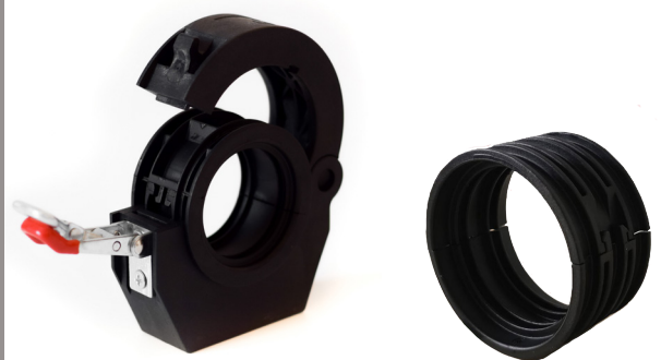
Kombischelle/Halbschale NW 52 60603012 schwarz Material: PA