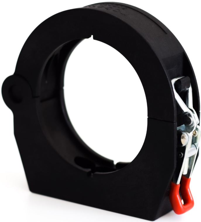
Systemhalter NW 70 60903013 schwarz Material: PA