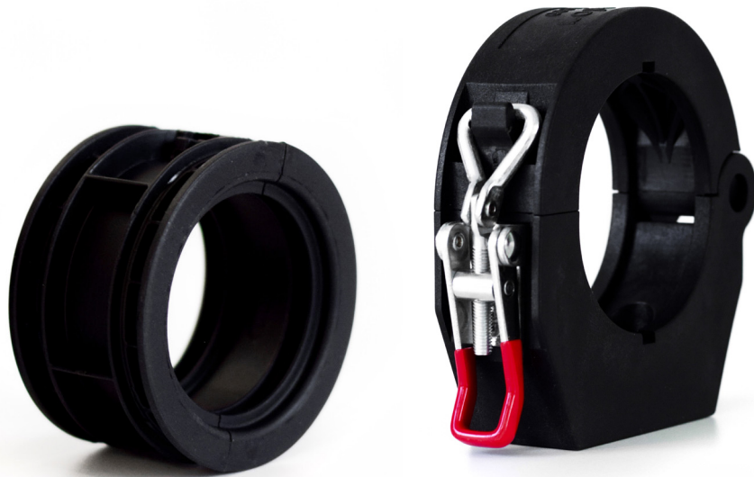
Kombischelle/Halbschale NW 48 60603012 schwarz Material: PA