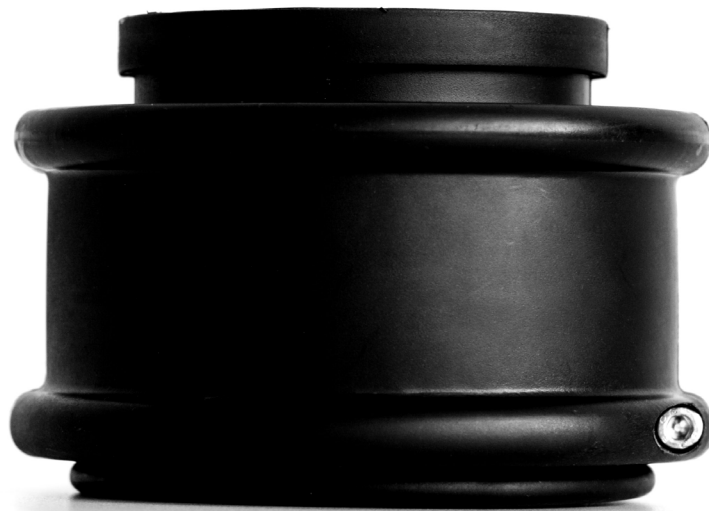
Kugelgelenk 60601700 schwarz Material: PA

Das Kugelgelenk ist kompatibel mit anderen gängigen Systemhaltern der NW 70 von verschiedenen Herstellern und alle gängigen Wellrohr Typen der NW 70.