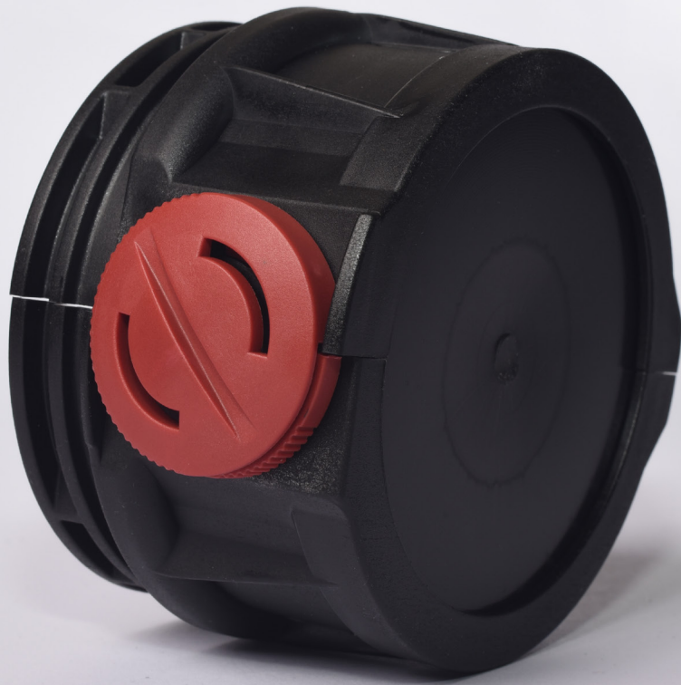
Aufnahme Zugentlastung 60901631 schwarz Material: PA